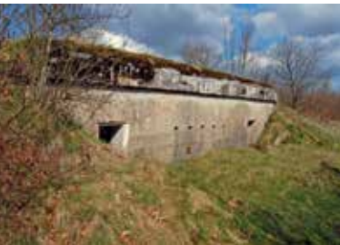
Anlage bei Rødekro/Rothenkrug

Mehr als 800 Bunker, Batterien, Schützengräben, Funk- und Signalstationen wurden ab 1916 zur „ Sicherungsstellung Nord “ (dänisch: Sikringsstilling Nord) ausgebaut, die sich 50 Kilometer lang von Rømø / Röm bis zur Djernisser Bucht am Kleinen Belt quer durch das damals deutsche Nordschleswig zog. Die kaiserliche Militärführung