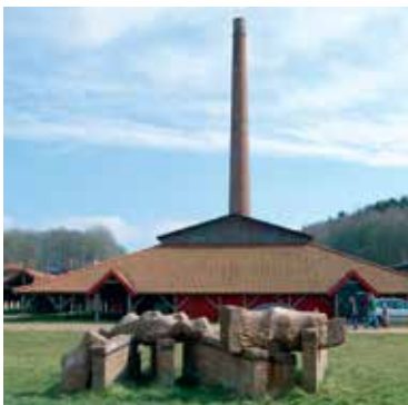
Das Ziegeleimuseum in Cathrinesminde

Das Cathrinesminde Teglværks Museum ist die letzte von einstmals acht Ziegeleien am Iller Strand. Hier können Maschinen, Werkzeuge und Arbeiterwohnungen aus der Zeit von 1890 bis 1960 besichtigt werden; außerdem gibt es eine geologische Sammlung (November bis März geschlossen). Illerstrandvej 7, Broager www.museum-sonderjylland.dk