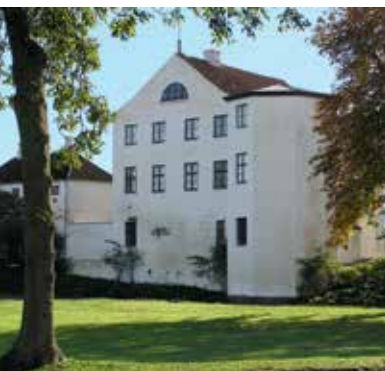
Kunstmuseum Brundlund Slot

versucht, im Galopp einen kleinen Ring aufzuspießen.