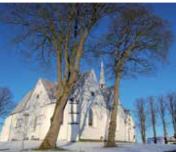
Kirche von Kliplev / Klipleff

In Kliplev / Klipleff südlich von Aabenraa / Apenrade steht Dänemarks ältestes erhaltenes Holzbauwerk: Der aus Eichenholz gebaute Glockenturm der Kirche stammt aus der Zeit um 1300. Im Mittelalter war der Ort am Ochsenweg ein wichtiges Pilgerziel. Aus dem 18. Jahrhundert stammt der „Mørks Kro“ neben der Kirche, eine der Gastwirtschaften am alten Ochsenweg.