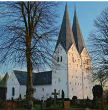
Die Kirche von Broager/Broacker

Noch heute werden am Nybøl Noor / Nübeler Noor und in Egersund / Ekensund Ziegel hergestellt. An die seit mehr als 200 Jahren bestehende Tradition erinnert das Ziegeleimuseum Cathrinesminde am Illerstrandvej. Wahrzeichen des Ortes ist die romanische Kirche mit ihrem markanten gotischen Doppelturm, dem einzigen im alten Herzogtum Schleswig.