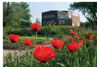
Nolde-Museum in Seebüll

Ein modernes Gebäude mit dem Museums-Shop und der Malschule des Nolde-Museums beherbergt auch das „ Café Seebüll “.