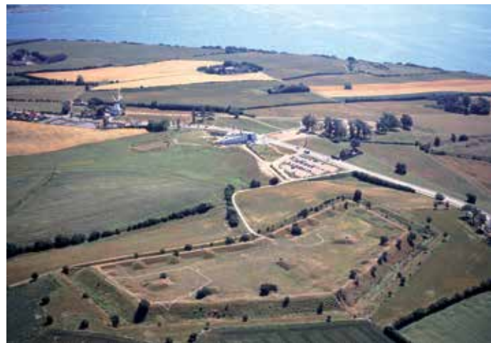
Im Vordergrund die preußische Schanze 10, mit den Spuren der dänischen Schanzen V und VI, dahinter das neue „Historiecenter Dybbøl Banke“

Die Düppeler Schanzen / Dybbøl Skanser sind eine nationale dänische Gedenkstätte. Die Erstürmung der Schanzen am 18. April 1864 nach wochenlanger Belagerung und heftigem Bombardement entschied den preußisch-österreichischen Krieg gegen Dänemark und führte dazu, dass Schleswig-Holstein preußische Provinz wurde. Zum Symbol der Schlacht wurde die Mühle am Rande der Schanzen vor Sønderborg / Sonderburg. Das „Museum Sønderjylland Historiecenter Dybbøl Banke“ schildert das Bombardement der dänischen Stellungen und ihre Erstürmung. Dabei verloren fast 3000 Menschen ihr Leben.