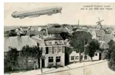
Luftschiff „Victoria Luise“

Bis zum Bau des Hindenburgdamms war Højer / Hoyer Fährhafen für die Verbindung nach Munkmarsch auf Sylt. Er entstand 1861, weil Tønder / Tondern durch Landgewinnung seine alte Position als Hafenstadt eingebüßt hatte. Mit dem neuen Deich wurde 1982 auch die bisherige Hoyer-Schleuse zum verträumten Naturidyll.