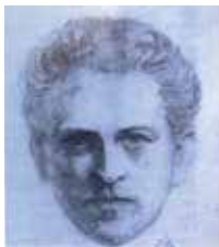
Ein in St. Gallen 1893 gezeichnetes Selbstportrait

Als viertes von fünf Kindern wurde am 7. August 1867 Emil Hansen in dem winzigen Dorf Nolde bei Burkal / Buhrkall geboren. Als Maler nahm er später den Namen seines Heimatdorfes an und machte es damit weltberühmt. Sein Geburtshaus steht nicht mehr, eine Gedenktafel erinnert noch daran. Mit der Ziehung der neuen Grenze 1920 nahm Nolde die dänische Staatsangehörigkeit an, die er sein Leben lang behielt.