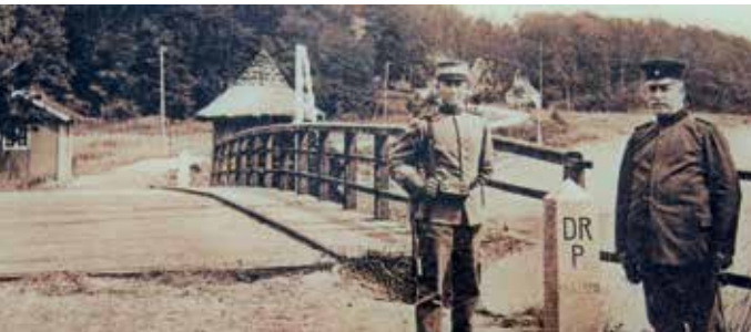
Grenzübergang Schusterkate in den 1920er Jahren

gang Schusterkarte – das sind die Merkmale des beliebten kleinen Wohnorts an der Förde.