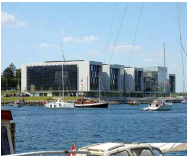
Das „Alsion“ in Sønderborg/Sonderburg