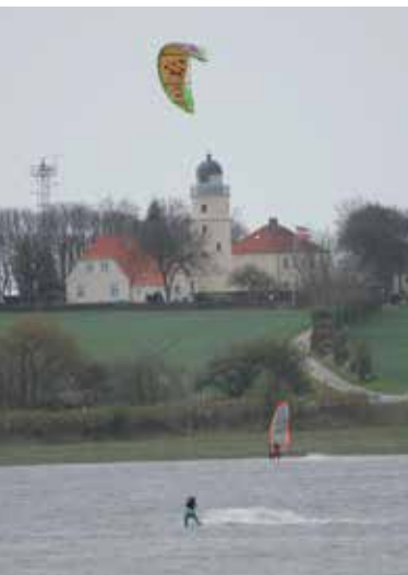
Leuchtturm von Kegnæs/Kekenis

Ursprünglich war Kegnæs / Kekenis an der Südspitze der Insel Als / Alsen eine eigene Insel; heute ist sie über eine Straße auf einem schmalen, von Strömung und Seegang geschaffenen Damm mit Alsen verbunden.