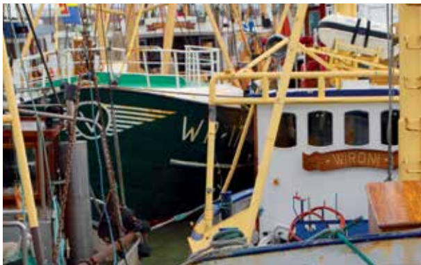
Fischkutter im Hafen von Havneby

Hærvejen 25, 6330 Padborg, www.bovkro.dk