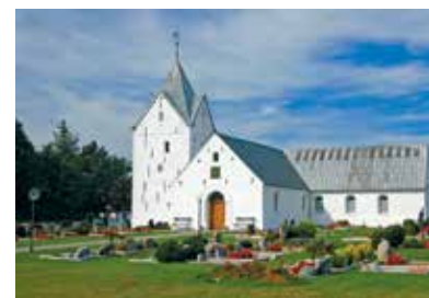
Die über 800 Jahre alte Kirche St. Clemens

Die Kirche St. Clemens stammt aus der Zeit um 1200; in ihrem Inneren hängen mehrere Votivschiffe. Umgeben ist sie von einem Friedhof mit Grabsteinen von Walfangkapitänen.