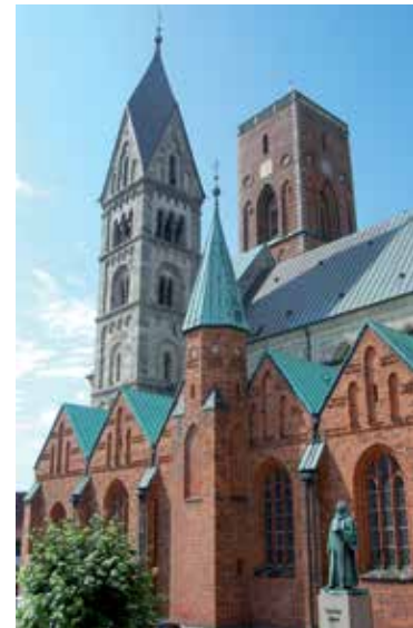
Der Dom von Ribe

Ribe/Ripen mit seiner sehenswerten Altstadt bezeichnet sich voll Stolz als Dänemarks älteste Stadt, die auf mehr als 1300 Jahre Geschichte zurückblicken kann. Übertagt wird sie von dem ursprünglich romanischen, später gotisch erweiterten Dom , der zum Teil mit rheinischem Tuffstein aus Andernach errichtet wurde. Südlich der Kirche wurden bei Ausgrabungen Gräber aus der Zeit um 900 gefunden. Vermutlich stand hier bereits die erste, um 860 gebaute Kirche von Ansgar, dem Apostel des Nordens. Seit 2015 erinnert ein modernes Denkmal an den Bischof des Bistums Hamburg-Bremen. Das Kloster von St. Catharinæ wurde 1228 von Benediktinern gegründet; die heutige Kirche von 1536 ist die dritte an dieser Stelle. Für Schleswig-Holsteins Geschichte ist der „ Vertrag von Ripen “ ein entscheidender Eckpfeiler: Im Jahr 1460 wurde er zwischen König Christian I., dem ersten Oldenburger auf dem dänischen Thron und der Ritterschaft geschlossen, die den König zum Grafen von Holstein gewählt hatte. Schleswig und Holstein, so versprach der König, sollten „bliven ewich tosamede ungedelt“. Im Mittelalter war Ribe eine königliche Enklave zehn Kilometer südlich der Kongeå / Königsaun und zählte nicht zum Herzogtum Schleswig. www.visitribe.dk , www.ribe-domkirke.dk