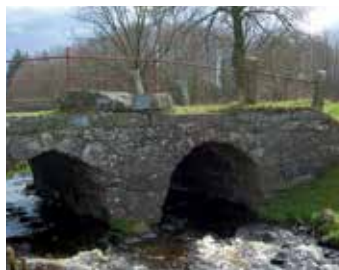
Brücke von Bommerlund