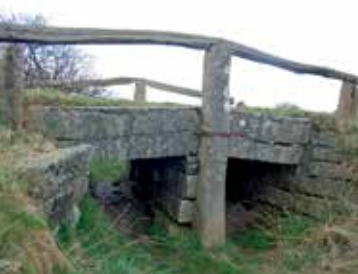
Brücke von Immervad / Immervatt

Jahrhunderte lang bildete die Kongeå / Königsau , über weite Strecken ihres 65 Kilometer langen Flusslaufes die Grenze – vor allem: die Zollgrenze – zwischen dem Herzogtum Schleswig und dem Königreich Dänemark. Nach 1867 trennte sie Dänemark und Preußen, von 1871 bis 1920 Deutschland und Dänemark. Bei Skodsborg, dort stand im Mittelalter eine Burg, überquerte der Ochsenweg die Grenze.