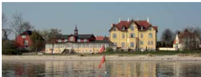
Das alte Badehotel von Aarø Sund

Königin Margrethe besuchte bei ihrem Aufenthalt auf Aarø auch den Brummers Gaard , einen restaurierten 150 Jahre alten Bauernhof mit einem Café. Der „Wein-Hof“ besitzt ebenfalls einen Hofladen (im Winter geschlossen). www.brummersgaard.dk , www.aaro-vin.dk