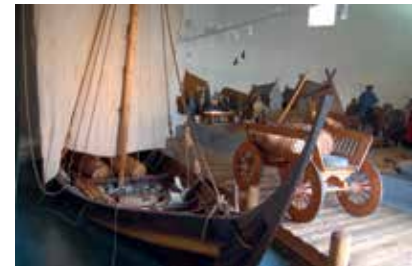
Wikinger in Ribe

Das ehemalige Schuldnergefängnis im alten Rathaus von 1496 beherbergt ein Museum zum Thema Recht und Rechtsprechung.