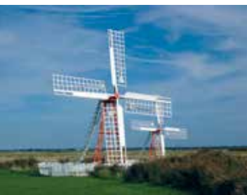
Bewässerungsmühlen von Ballum

Zwei Bewässerungsmühlen aus dem 19. Jahrhundert und ein kleines Museum erinnern daran, dass das Wasser der Nordsee früher eine ständige Bedrohung, genießbares Trinkwasser jedoch knapp war.