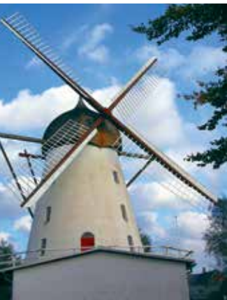
Mühle von Jels