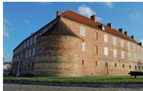
Das mächtige Schloss am Ostseestrand

Ringreiten ist Nordschleswigs Traditionssport. Aabenraa / Apenrade und Sønderborg / Sonderburg wetteifern um das größte Ring-