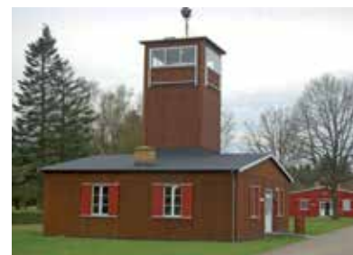
Lagermuseum in Frøslev / Frøslee

Das ehemalige deutsche Lager in Frøslev / Frøslee ist heute eine dänische nationale Gedenkstätte . 1944/45 diente es als Gefangenenlager der deutschen Sicherheitspolizei, hauptsächlich für Widerstandskämpfer. 1943, als die Deportationen von Dänen in deutsche Zuchthäuser