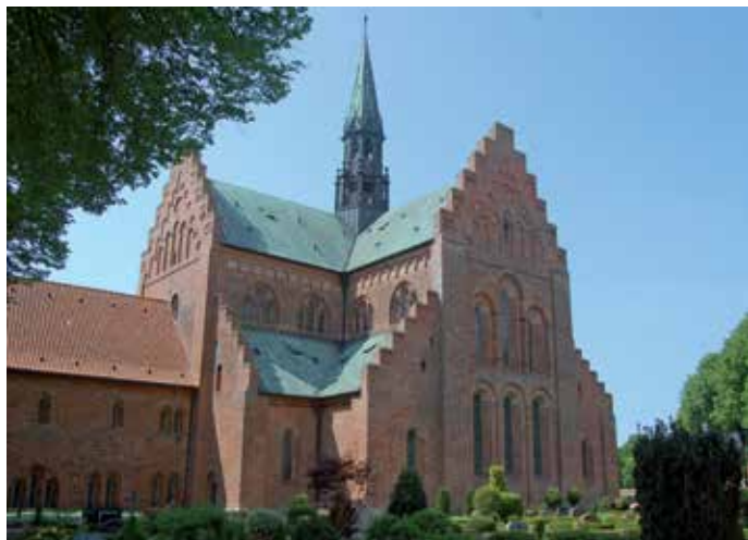
Kirche von Løgumkloster / Lügumkloster

In der Kirche finden regelmäßig auch Gottesdienste auf Deutsch statt. Um 1585 ließ Herzog Adolf von Schleswig-Holstein-Gottorp westlich der Kirche einen neuen Flügel als herzogliches Jagdschloss anbauen.