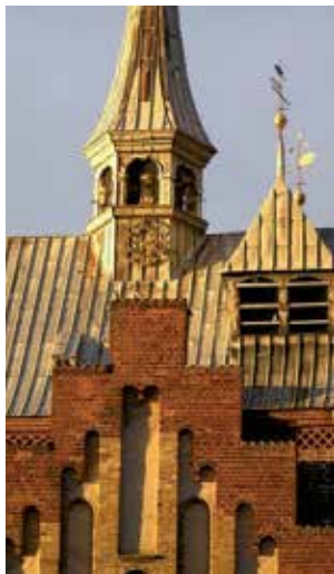
Dom St. Marien

Der gotische Dom St. Marien war ursprünglich eine Kollegiatskirche, eine „Filiale“ des Schleswiger Doms. Die Kalkmalereien im Inneren der imposanten Hallenkirche, stammen aus dem 15. und frühen 16. Jahrhundert. Die Orgel mit ihren 73 Stimmen und gut 5000 Pfeifen ist die zweitgrößte in Dänemark. Im Sommer finden regelmäßig Kirchenkonzerte statt. Zu den vielen sehenswerten alten Gebäuden der Stadt gehören das Herzog Hans Hospital von 1569 mit der dazugehörenden Kirche, aber auch die Häuser in der Slotsgade / Schlossstraße und der Præstegade / Pastorenstraße mit dem Pastorat von 1751. Einmalig in Dänemark ist der 2014 eröffnete Streetdome in Hafennähe, ein Mekka des Straßensports, ob Skate-