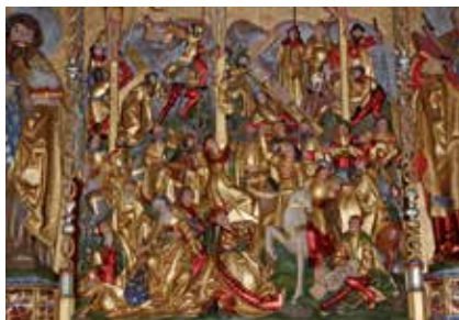
Der spätgotische Flügelaltar

der Bauernsteinzeit (etwa 3200 v. Chr.), erhalten. Rund 1 000 Jahre lang wurde der Hügel als Begräbnisstätte genutzt.