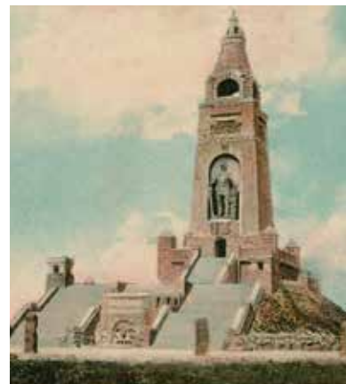
Bismarckturm vom Knivsberg

Bis 1945 stand auf dem „Berg“ ein Bismarck-Turm. Die Bismarck-Statue selbst wurde 1919, vor der Abstimmung von 1920, abmontiert und später auf dem Aschberg (Kreis Rendsburg-Eckernförde) neu aufgestellt. Den Turm sprengten dänische Widerstandskämpfer im August 1945.