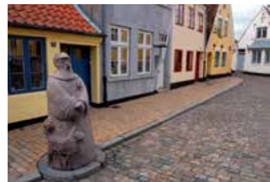
Wächterplatz in Aabenraa/Apenrade

Idyllisch und zum Teil unter Denkmalschutz sind die Straßen und Gassen rund um die Kirche und den Wächterplatz . Mehr über die Geschichte der Stadt erfahren Besucher bei einer ganz speziellen Führung: Während der