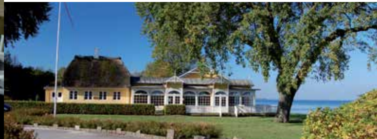
Fährkrug von Ballebro