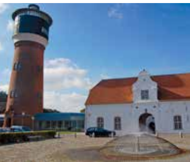
Torhaus und Wasserturm

gezeigt. www.tondermuseum.dk , www.sonkunst.dk