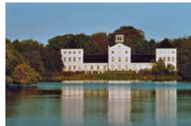
Das Schloss von Gråsten/Gravenstein

(grauen) steene“ errichten; 1725 ging es in einer Auktion an Herzog Christian August I. von Augustenburg. Nach einem Großbrand 1757 wurde der ursprünglich pompösere Mittelflügel der barocken Anlage nur in bescheidenem Umfang wieder aufgebaut. Bis 1921 blieb das Schloss – mit Unterbrechungen durch die Zeit zwischen 1848/50 und 1864 – als Sommerresidenz im Besitz der Herzöge von Schleswig-Holstein-Sonderburg-Augustenburg.