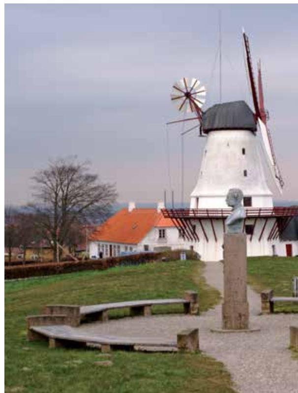
Die Mühle von Dybbøl/Düppel

Tel. 00 45 - 7362 0331; Öffnungszeiten unter www.nordschleswig.dk/schulmuseum