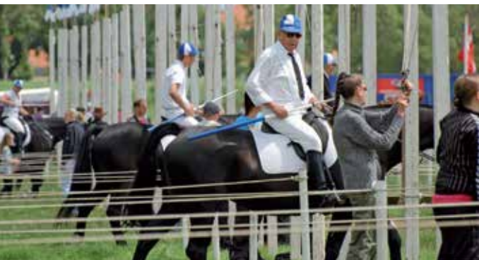
Ringreiterfest in Aabenraa/Apenrade

reiterfest. Mehr als 500 Reiter treten allein in Sonderburg an. Der Geschichte des Reiterwettkampfs, der seinen Ursprung in den Ritter-Turnieren des Mittelalters hat, ist das Ringreitermuseum in einem der ältesten Häuser der Stadt gewidmet.