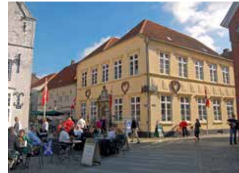
Gamle Apotek in Tøndern

Eine besondere Sehenswürdigkeit ist die alte Apotheke („ Gamle Apotek “) von 1671. Dort werden allerdings keine Salben und Pillen verkauft, sondern Dekoratives für zu Hause. Zu den malerischsten Straßen der Stadt zählt die Uldgade mit ihren niedrigen einstöckigen Giebelhäusern.