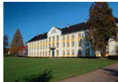
Das Schloß am Augustenborgfjord.