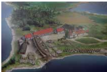
Das Modell zeigt den Schiffbau um 1850

Bei Skarrev / Schäriff im Süden der Halbinsel ist Myrpold , eine drei Meter lange Grabkammer aus