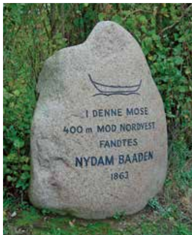
Gedenkstein für das Nydam-Boot