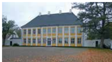
Das Herrenhaus von Sandbjerg/Sandberg