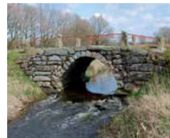
Povlsbro / Paulsbrücke