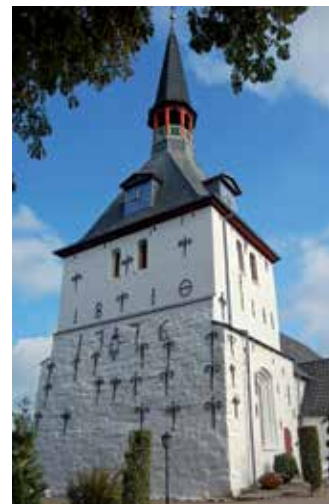
Kirche von Tinglev / Tingleff

In ihren ältesten Teilen romanischen Ursprungs ist die Kirche; Die prächtige Kanzel aus der Zeit um 1614 stammt aus der Werkstatt des Flensburger Bildhauers Heinrich Ringerink.