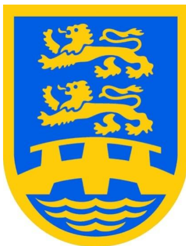
Das Wappen zeigt die beiden schleswigschen Löwen und die stilisierte Immerwatt Brücke als Symbol für die Brückenfunktion der deutschen Volksgruppe.

grenze von 1920 endgültig an und gab eine Loyalitätserklärung gegenüber dem dänischen Staat ab. Die Absage an eine Grenzverschiebung war ein deutliches Signal an die dänische Seite, dass seitens der deutschen Volksgruppe um Verständnis für ihre geschichtlich-kulturelle Identität und ihre weitere Existenz innerhalb des dänischen Nationalstaates geworben wurde. Es war ein Appell an den Staat, den Mitgliedern der deutschen Volksgruppe eine gleichberechtigte Behandlung zu sichern. Darauf musste die deutsche Volksgruppe aber noch zehn Jahre warten bis zu den Bonn-Kopenhagener Erklärungen von 1955 warten.