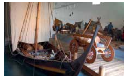
Vikinger i Ribe