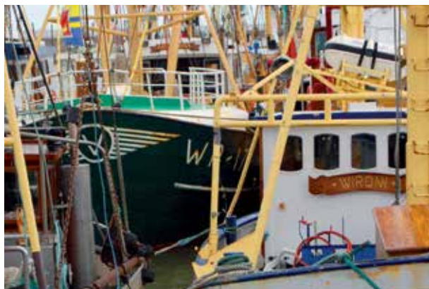
Fiskekutter i havnen i Havneby

Hærvejen 25, 6330 Padborg, www.bovkro.dk