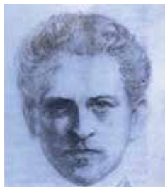
Et selvportræt, tegnet i St. Gallen i 1893

Emil Hansen blev født den 7. august 1867 som det fjerde af fem børn i den lillebitte landsby Nolde ved Burkal. Som maler tog han senere navn efter sin barndoms landsby og gjorde den således verdensberømt. Hans barndomshjem findes ikke længere, men der er opstillet en mindetavle. Efter grænseflytningen i 1920 blev Nolde dansk statsborger, hvilket han forblev resten af livet.