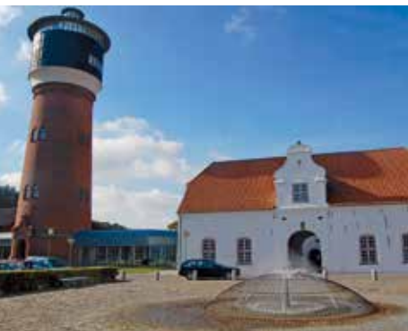
Porthus og vandtårn

Museet i det tidligere porthus af Tønder Slot huser Danmarks største samling af hollandske fliser og en overdådig sølvudstilling; begge vidner om Tønders storhedstid som havneby.