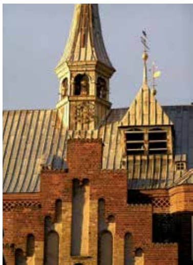
Domkirken Vor Frue Kirke

Haderslev Museum (Dalgade 7) er Sønderjyllands arkæologiske museum. Man kan se Danmarks ældste grav samt en stor udstilling om jernalderen med det omfangsrige fund fra Ejsbøl, en offermose, hvor der siden 1955 er blevet bjærget hundredvis af ubrugeliggjorte våben fra tiden mellem 300 og 500 e.Kr.