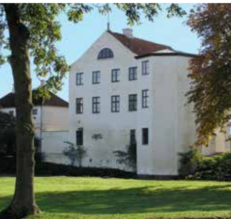
Kunstmuseum Brundlund Slot