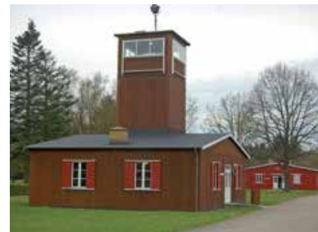
Lejrmuseum i Frøslev

Et fælles dansk-tysk projekt var renatureringen af Frøslev Mose, som syd for grænsen fortsætter under navnet Jardelunder Moor. I alt 575 hektar, heraf 275 hektar mose, er i dag fredet. Mere om den markerede vandrerrute på www.udinaturen.naturstyrelsen.dk