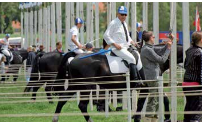
Ringridderfest i Aabenraa/Apenrade