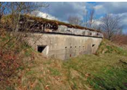
Anlage bei Rødekro/Rothenkrug

Flere end 800 bunkere, batterier, skyttegrave, radio- og signalstationer blev fra 1916 udbygget til „Sikringsstilling Nord“, som strakte sig over 50 kilometer fra Rømø til Diernæs Bugt ved Lillebælt gennem det dengang tyske Sønderjylland. Den kejserlige militærledelse