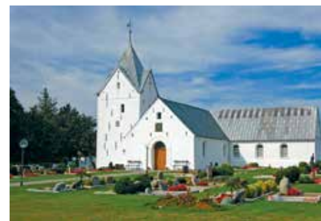
Den over 800 år gamle Sct. Clemens Kirke

I kunsthistorien står stedet for væverhåndværket fra 1896 til 1919. I denne tid blev der fremstillet tæpper, som var præget af kunstretningen jugendstil, efter udkast fra over 50 kunstnere, bl.a. Heinrich Vogeler og Henry van de Velde. Værker fra den såkaldte Skærbæk Væveskole udstilles på Museumsberg i Flensborg og på Sønderborg Slot.