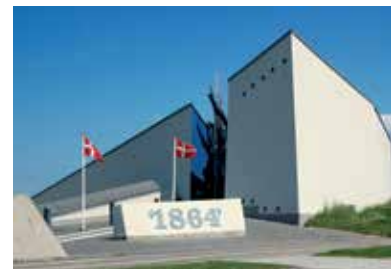
Museum Sønderjylland Historiecenter Dybbøl Banke