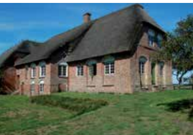
Kommandørgården stammer fra 1748.

Kommandørgården i Toftum (kaptajnerne på hvalfangerskibene blev kaldt kommandører) er en gård fra 1748, som viser velstanden, som søfarerne og især hvalfangerne bragte til Rømø.