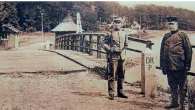
Grænseovergang ved Skomagerhus i 1920'erne