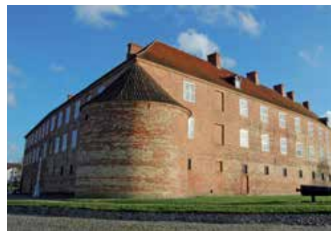
Det mægtige slot ved Allsund

Ringridning er en sønderjysk tradition. Aabenraa og Sønderborg konkurrerer om den største ringriderfest. I Sønderborg deltager flere end 500 ryttere. Ringriddermuseet i et af byens ældste huse viser historien om rytterkonkurrencen, som har sin oprindelse i middelalderens ridderstævner.