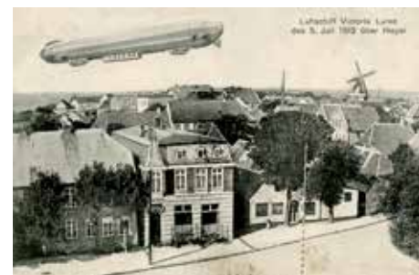
Luftskibet „Victoria Luise“

Hvis man her tager vejen mod syd til grænsen ved Rudbøl, kører man over det første dige, som blev oprettet på området af nutidens Danmark. Det stammer fra 1556.