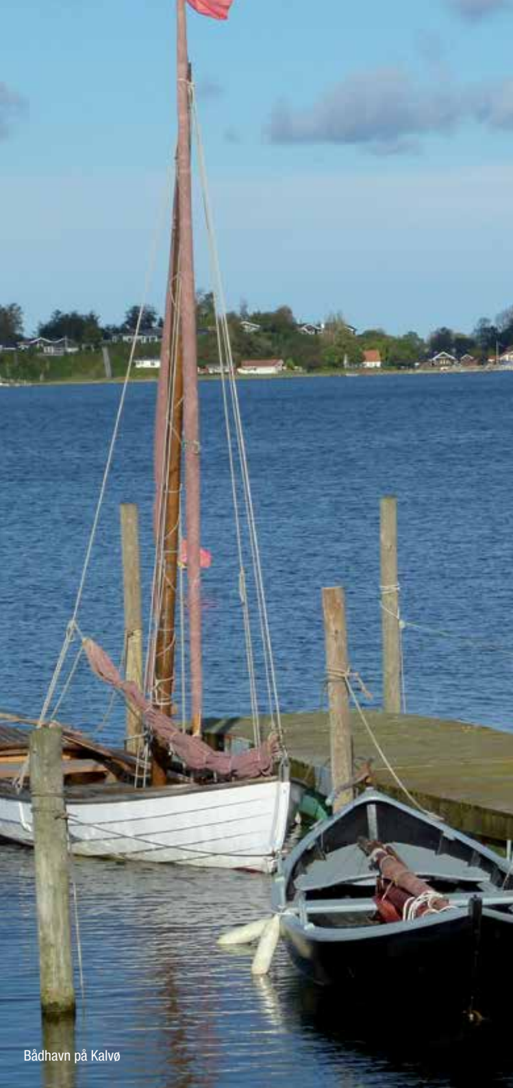
Bådhavn på Kalvø

Ballebro Færgeskro , Færgevej 5, Sønderborg, Tel. 00 45 7446 1303, www.ballebro.dk