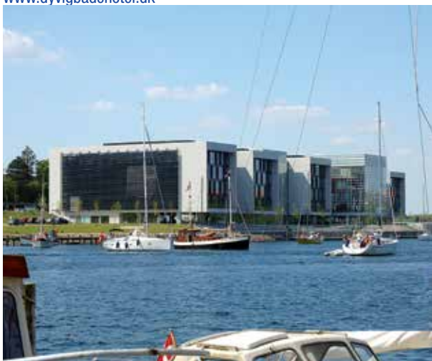
Alsion i Sønderborg