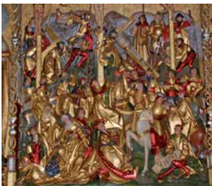
Det sengotiske fløjalter

I ca. 1 000 år blev bakken brugt som gravsted.