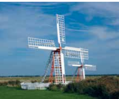
Afvandingsmøller i Ballum

To afvandingsmøller fra 1800-tallet og et lille museum vidner om, at vandet fra Vesterhavet dengang var en konstant trussel, men at drikkevand var en begrænset ressource.