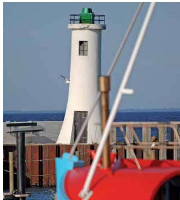
Aftenstemning på havnen i Mommark

www.rudbol.dk , www.alter-deutscher-grenzkrug.de