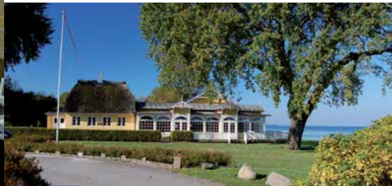
Færgeskroen i Ballebro