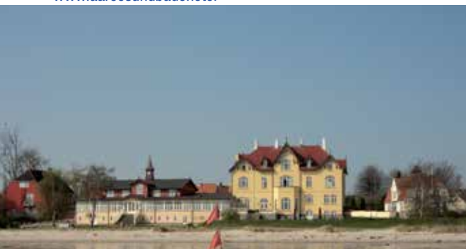
Aarø sund Badehotel

Dronning Margrethe besøgte ved sit ophold på Årø også Brummersgaard, en restaureret 150 år gammel bondegård med en café. Vingården råder også over en gårdbutik (lukket om vinteren).